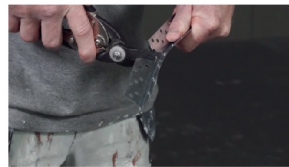
คิ้วเข้ามุมโลหะ Metal corner bead