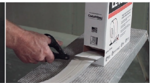
ยิปรอก เลเวลไลน์ gyproc® Levelline

ยืดหยุ่นสูง สามารถปรับให้เข้าได้กับทุกองศาของมุม FLEXIBLE - flexes to any inside or outside corner angle required