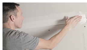
มุมใน Inside corner