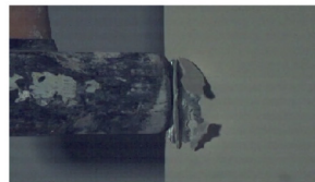
คิ้วเข้ามุมโลหะ Metal corner bead