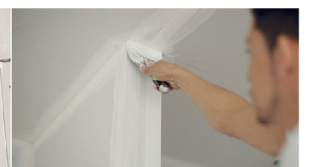
มุมนอก Outside corner